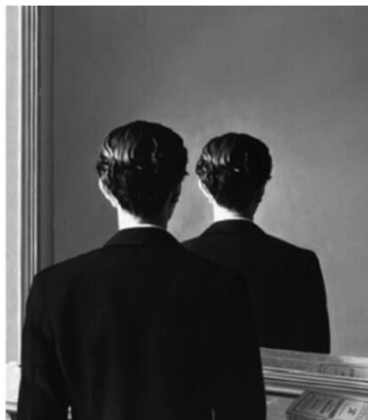
MAGRITTE, R. A reprodução proibida . Óleo sobre tela, 81,3 x 65 cm. Museum Boijmans Van Buningen, Holanda, 1937.

O Surrealismo configurou-se como uma das vanguardas artísticas europeias do início do século XX. René Magritte, pintor belga, apresenta elementos dessa vanguarda em suas produções. Um traço do Surrealismo presente nessa pintura é o(a)