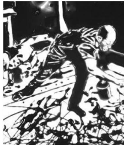
MUNIZ, V. Action Photo (segundo Hans Namuth em Pictures in Chocolate ). Impressão fotográfica, 152,4 cm x 121,92 cm, The Museum of Modern Art, Nova Iorque, 1977.

CHIPP, H. Teorias da arte moderna . São Paulo: Martins Fontes, 1988.