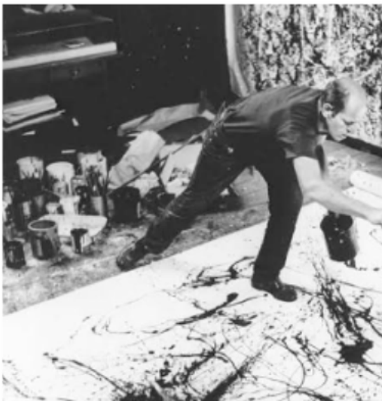
Fotografia de Jackson Pollock pintando em seu ateliê, realizada por Hans Namuth em 1951.