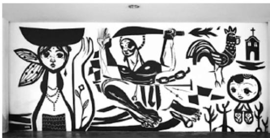
SPETO. Grafite . Museu Afro Brasil, 2009.

Disponível em: www.diariosp.com.br . Acesso em: 25 set. 2015.