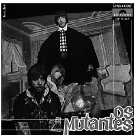
Capa do LP Os Mutantes , 1968.

Disponível em: http://mutantes.com . Acesso em: 28 fev. 2012.