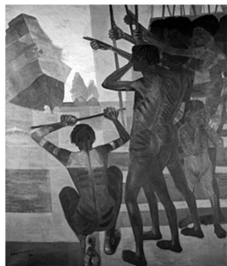
PORTINARI, C. O descobrimento do Brasil . 1956. Óleo sobre tela, 199 x 169 cm. Disponível em: www.portinari.org.br . Acesso em: 12 jun. 2013.

Pertencentes ao patrimônio cultural brasileiro, a carta de Pero Vaz de Caminha e a obra de Portinari retratam a chegada dos portugueses ao Brasil. Da leitura dos textos, constata-se que