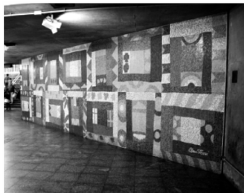
TOZZI, C. Colcha de retalhos . Mosaico figurativo. Estação de Metrô Sé. Disponível em: www.arteforadomuseu.com.br . Acesso em: 8 mar. 2013.

Colcha de retalhos representa a essência do mural e convida o público a