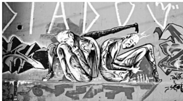
Arte Urbana.

O grafite contemporâneo, considerado em alguns momentos como uma arte marginal, tem sido comparado às pinturas murais de várias épocas e às escritas pré-históricas. Observando as imagens apresentadas, é possível reconhecer elementos comuns entre os tipos de pinturas murais, tais como