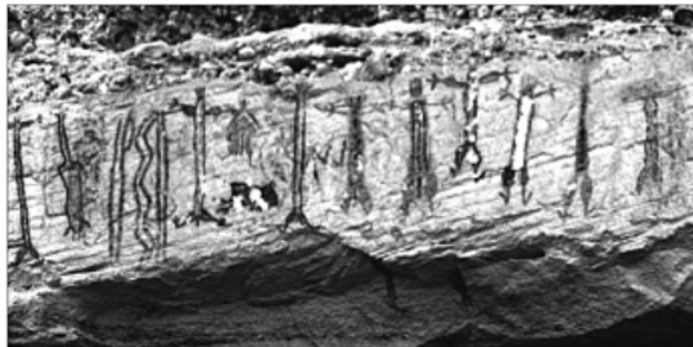
Toca do Salitre – Piauí