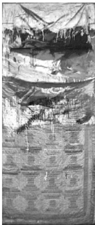
RAUSCHENBERG, R. Cama . Óleo e lápis em traveseiro, colcha e folha em suporte de madeira, 191,1 x 80 x 20,3 cm. Museu de Arte Moderna de Nova York, 1995. Disponível em: www.moma.org . Acesso em: 8 jun. 2017.