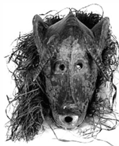
Máscara senufo, Mali. Madeira e fibra vegetal. Acervo do MAE/USP.

As formas plásticas nas produções africanas conduziram artistas modernos do início do século XX, como Pablo Picasso, a algumas proposições artísticas denominadas vanguardas. A máscara remete à