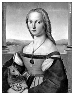
SANZIO, R. (1483-1520). A mulher com o unicórnio . Roma, Galleria Borghese. Disponível em: www.arquipelagos.pt . Acesso em: 29 fev. 2012.

CAMÕES, L. Obra completa. Rio de Janeiro: Nova Aguilar, 2008.