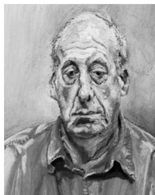
FREUD, L. Francis Wyndham . Óleo sobre tela, 64 x 52 cm. Coleção pessoal, 1993.