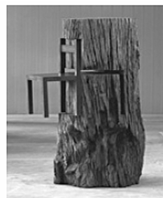
LEIRNER, N. Tronco com cadeira (detalhe), 1964. Disponível em: http://www.itaucultural.org.br . Acesso em: 27 jul. 2010.

Nessa estranha dignidade e nesse abandono, o objeto foi exaltado de maneira ilimitada e ganhou um significado que se pode considerar mágico. Daí sua "vida inquietante e absurda". Tornou-se ídolo e, ao mesmo tempo, objeto de zombaria. Sua realidade intrínseca foi anulada.