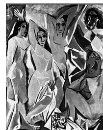
Picasso, P. Les Femmes d'Alger (O Version O), Nova York, 1907. ALCANTARA, D. C. Arte moderna: do Impressionismo aos movimentos contemporâneos. São Paulo: Companhia das Letras, 1992.

O quadro Les Femmes d'Alger (1907), de Pablo Picasso, representa o rompimento com a estética clássica e a revolução da arte no início do século XX. Essa nova tendência se caracteriza pela