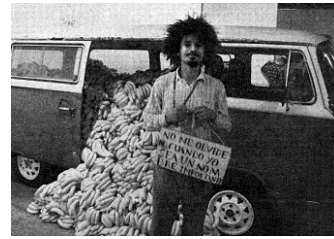
(Tradução da placa: “Não me esqueçam quando eu for um nome importante”.) NAZARETH, P. Mercado de Artes / Mercado de Bananas, Museu Art Basel, EUA, 2011. Disponível em: www.difone.com.br . Acesso em: 31 jul. 2012.

A contemporaneidade identificada na performance / instalação do artista mineiro Paulo Nazareth reside principalmente na forma como ele