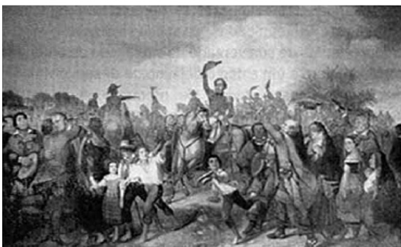
MOREAUX, F. R. Proclamação da Independência