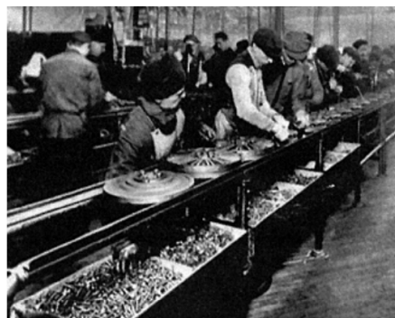
Disponível em: http://primeira-serie.blogspot.com.br . Acesso em: 07 dez. 2011 (adaptado).

Na imagem do início do século XX, identifica-se um modelo produtivo cuja forma de organização fabril baseava-se na