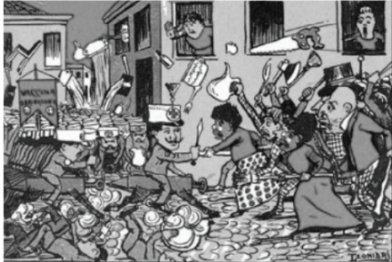
Charge capa da revista "O Malho", de 1904.

A imagem representa as manifestações nas ruas da cidade do Rio de Janeiro, na primeira década do século XX, que integraram a Revolta da Vacina. Considerando o contexto político-social da época, essa revolta revela